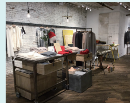
メイキング・スペース：ニューヨークのファッションデザイナー、アイリーン・フィッシャーがブルックリンに開設した新業態。シンプルなデザインで長く着られるのが魅力。