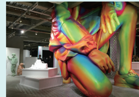
ヴァージル・アブローが手がけた初のルイ・ヴィトンメンズコレクションのポップアップショップ。2019年1月10日に原宿にオープン。