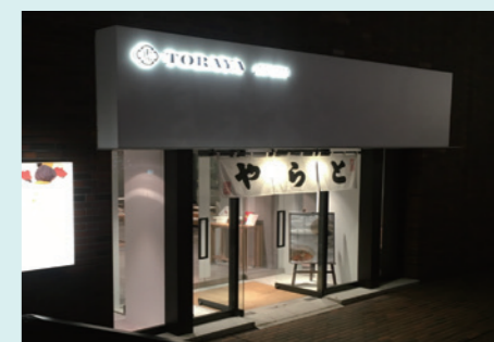
TORAYA AOYAMA：スポーツ時の羊羹の効用に注目し、オリンピック会場に隣接する青山の地に、2021年までの期間限定で2018年7月にオープン。スポーツウェアのままでも気軽に立ち寄れる。