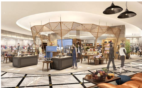
▲ atre 3階