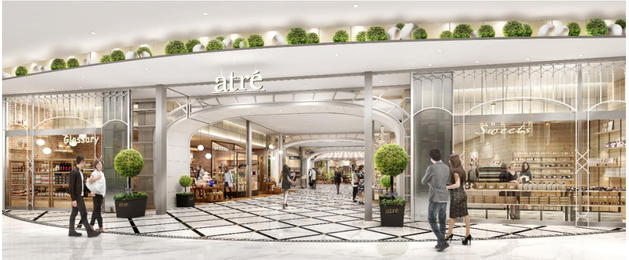
▲ atre 2階エントランス (アイアンワークと柔らかな曲線のアーチを連続させお出迎え感を演出)