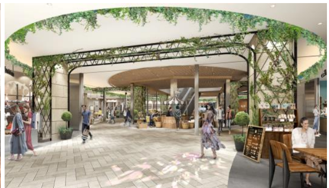
▲ atre 4階