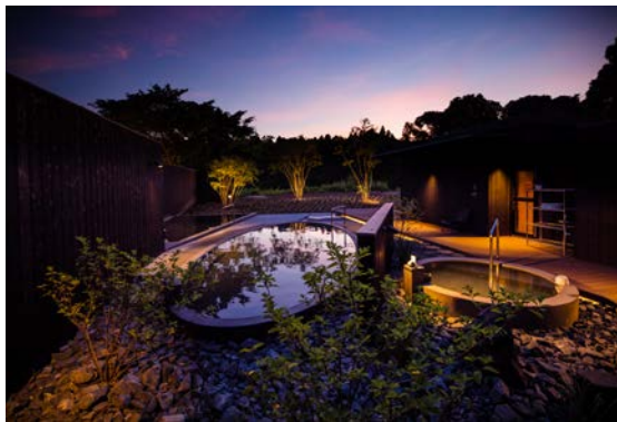
自生の桜の木を生かした楕円の特徴的な露天風呂

自然の景色を眺めながら極上の「ととのう」が体験できるよう、テントサウナ・露天風呂・水風呂・外気浴、本格フィンランド式サウナを配置。