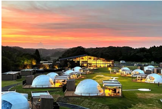
凹凸のある敷地形状を生かし、ドームテント位置を決定

もともとの自然環境を最大限生かし、丁寧な測量、ランドスケープ、マスタープランを計画。満天の星空が体感でき、自生する植物（桜の木など）を生かすなど、自然環境に負荷をかけないランドスケープデザインを計画しました。