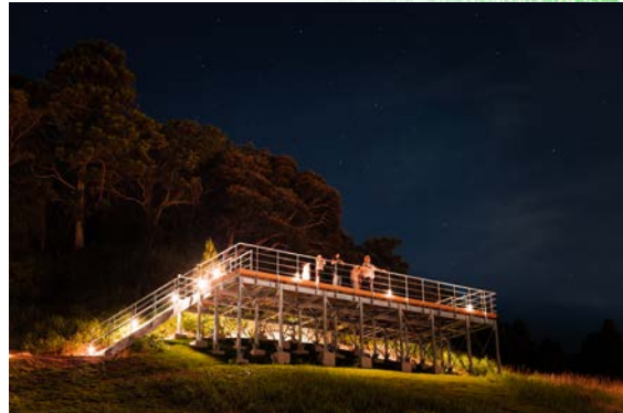
一番の高台には星空デッキ・可惜夜殿（あたらよでん）を配置