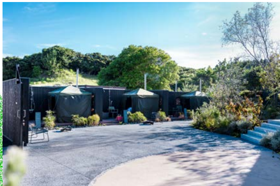
廃瓦をリサイクルして作った舗装材/テントサウナ