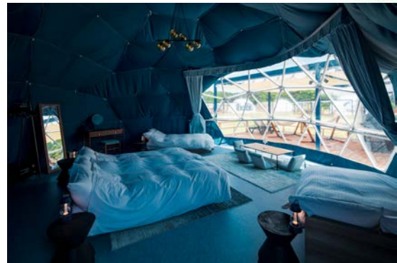
星空を満喫できるドームテント

本案件を推進したエシカルデザイン本部 ZERO Divisionでは、未来の環境へ配慮した新規事業創造に力を入れています。船場は今後も「未来にやさしい空間を」をミッションに、エシカル活動を推進します。