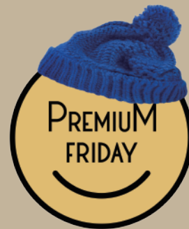
▲プレミアムフライデーのロゴ初回となる2月は、青ニット帽をかぶったこの顔が目印。

2月24日から実施される プレミアムフライデー 。毎月末の金曜日は午後3時には仕事を終え、ショッピングや外食、旅行と消費活動がしやすくなることで、個人消費を盛り上げるのが狙い。